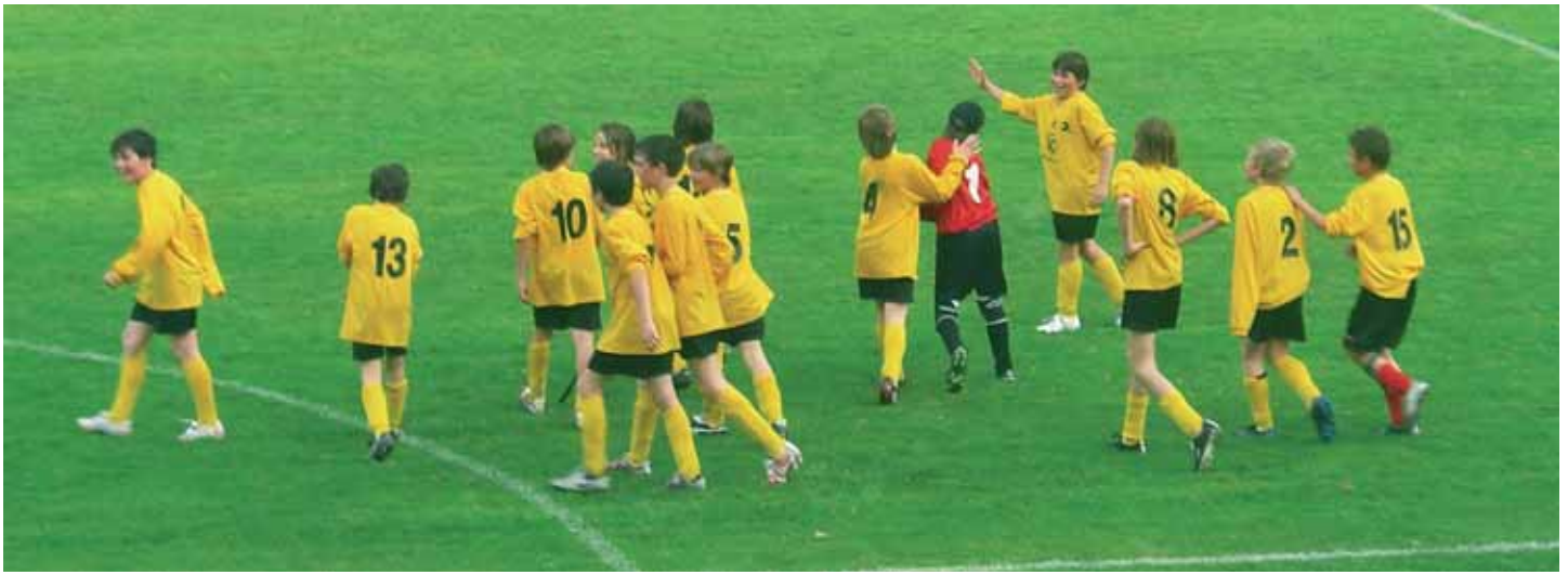
Die Unter 11 feiert ihren Meistertitel beim letzten Saisonspiel am vergangenen Montag in Auer.

wäre dies der erste Landesmeistertitel für die Jugendförderung. Doch Titel hin oder her, die Leistungen des Projektes können sich in jedem Fall sehen lassen und sind nicht nur an den Ergebnissen festzumachen. Die Jugendförderung verfolgt nach wie vor zwei Ziele: sportlich erfolgreich zu sein und gleichzeitig ihrer sozialen Rolle in den Dörfern gerecht zu werden.