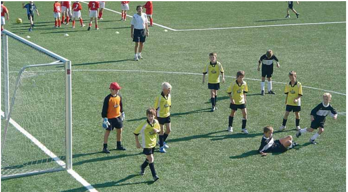
Der Kunstrasenplatz in St. Pauls bildet seit zwei Jahren den Haupttrainingsplatz für die Jugendförderung.