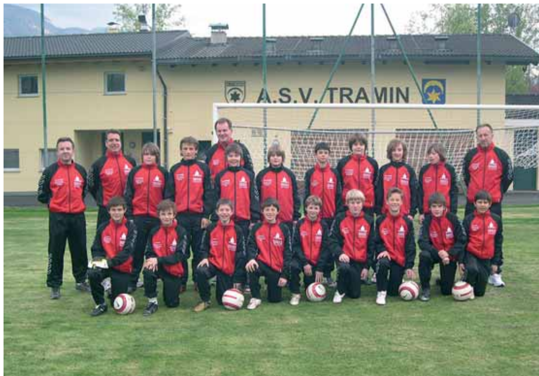
Die Überetsch-Unterland-Auswahl, die an den kommenden beiden Wochenenden an der Mini-EM im Vinschgau teilnehmen wird.

Pichler und Peverotto mit der Südtirol-Auswahl der B-Jugend bei diesem Turnier mit.